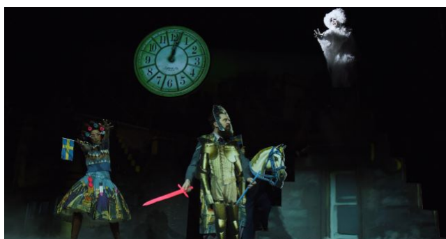
Das kleine Gespenst von Otfried Preußler, Landestheater Niederösterreich 2021, Inszenierung: Aslı Kışlal

Ich denke, dass Menschen, die Bildung genossen haben, ein größeres Bedürfnis haben, sich mit Kunst zu beschäftigen. Sie haben einen anderen Zugang zu Kunst und Kultur. Es gibt jedoch sehr wohl Unterschiede, je nachdem über welchen Klassenhintergrund jemand verfügt und ob Zugang zu Kunst mit dem Bildungsaufstieg entsteht oder ob aufgrund der Klassenzugehörigkeit Zugang und eine gewisse Selbstverständlichkeit bereits immer da waren – also das Verfügen über Sprache, Codes und Verhaltenskodex, um sich anzupassen und zugehörig zu fühlen – oder ob dies noch zu lernen ist. Auch wenn es erlernbar wäre, muss das nicht bedeuten, dass das Gefühl der Zugehörigkeit zur akademischen Schicht und der Zugang zu Kunst somit vorhanden ist. Aber ja, prinzipiell denke ich, dass das Bedürfnis, Kunst und Kultur zu genießen, sehr stark mit der Frage zusammenhängt, ob Bildung genossen wurde.