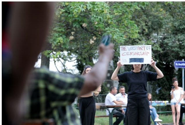
diverCITYLAB Produktion 2018: tent sweet tent