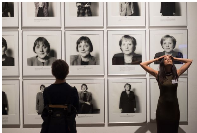
diverCITYLAB produktion 2017: Community College

Das soll nicht bedeuten, dass wir bereits angekommen sind. Wir sind am Anfang, die Diskussionen haben erst jetzt begonnen. Diese führen natürlich in unterschiedlichen Ecken zu Panik. Denn es gibt jetzt neue Sprachen und einen anderen Codex, und die etablierten Institutionen haben Angst, da sie diesen Codex nicht beherrschen. Panik ist gut. Es bedeutet Entwicklung. Wir haben in diesem Gebilde dreißig Jahre lang mit Panik gelebt und versucht uns anzupassen, um die Institutionen zu verändern, und nun sind sie dran, diesen neuen Codex zu integrieren und den Panikzustand zu erleben. Es flößt Institutionen ja schon Angst ein, die Frage zu beantworten, wie viele Frauen in Leitungspositionen sind, da es ihren Ist-Zustand vor Augen führt und sie sagen müssen, dass Gleichberechtigung nicht stattfindet.