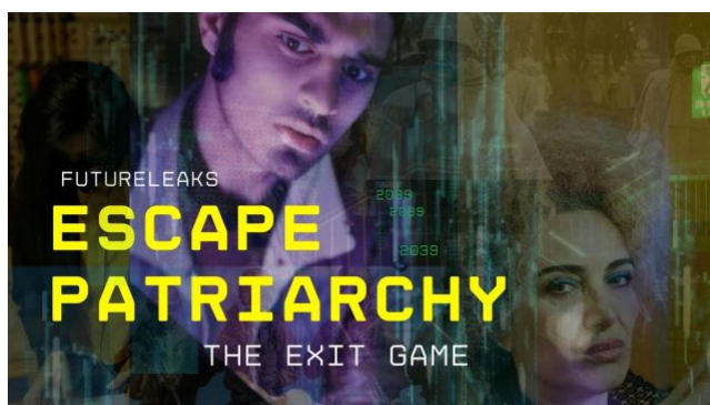
diverCITYLAB Produktion 2022: Escape Patriarchy

Das ist auch eine Kritik an mich. Bei diverCITYLAB sprechen wir von einer partiellen Diversität. Ziel ist es aber sehr wohl, die verschiedenen Diversitäten unserer Gesellschaft abzubilden. Mein Zugang ist dabei geprägt durch theoretische Ansätze, aber auch durch meine Befindlichkeit und meine Betroffenheit. Projekte kommen oftmals über die eigene Wahrnehmung, durch das eigene Erlebnis und durch das System, das man versucht zu öffnen, zustande. Da spielt immer die Frage der eigenen Möglichkeiten mit. Deshalb auch die Kritik – im Sinne von interner Kritik im Team – dahingehend, dass wir es schaffen müssen, andere Menschen anzusprechen und andere Diversitätskonzepte zu berücksichtigen. Aber ja, das Feld, in dem wir interagieren, ist bereits sehr groß und braucht so viel Kraft, dass wir es bis jetzt nicht schaffen konnten, uns noch mehr zu öffnen. Ich begrüße jegliche Konzepte von Diversität, die auch ihre eigene Betroffenheit zur Sprache bringen, und denke, dass es eine gegenseitige Unterstützung braucht. Dabei lerne ich jeden Tag aufs Neue, wo es noch fehlt, wie viele noch nicht mitbedacht sind oder nicht genannt werden. Das bricht die Norm, das „Normale“, das „Angenommene“, eben das, was bis jetzt gängig und akzeptiert war.