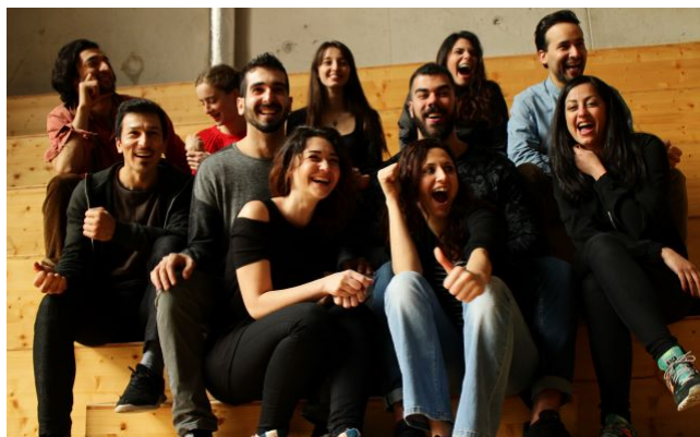
diverCITYLAB Studierende 1.-2. Jahrgang 2016

Solch ein Zugang trennt jedoch in Positionen von ‚wir‘, die Anbietenden, und ‚die‘, die Konsumierenden. Auch ein Workshop ist eine Konsumation, wenn es keine Teilhabe in dem Sinne, dass ich mitgestalte oder mitentscheide, gibt. Die Konzepte, in welchen Mitgestaltung und Mitbestimmung mitgedacht werden, sind erst später hinzugekommen, weil immer mehr erkannt wurde, dass es nicht ausreichend sein kann, die Türen zu öffnen und zu sagen: „Kommt, wir machen einen Workshop nur für euch.“ Dieser Zugang offenbart einen Statusunterschied, und wenn man sich als Institution wirklich öffnen möchte, muss man diesen gap schließen.