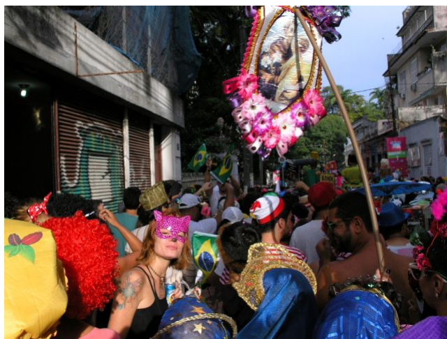
Brasilien am Main, Für Nívea, 2016 © Amalia Barboza

In der Zeit wohnte ich noch in Frankfurt, aber ich hatte schon an die Universität des Saarlandes gewechselt, wo ich seit 2013 als Junior-Professorin für Kulturwissenschaften unterrichtete. Mit den Studierenden befassten wir uns mit Orten in der Stadt, die von Migrant:innen gestaltet wurden. Wir besprachen auch verschiedene Ansätze, die in der Zeit zur Diskussion standen: Transkulturalität, Interkulturalität, Heimat in der Ferne, Diversität, bewegte Heimat, Transtopien waren einige der Themen. Nicht nur diese Konzepte, sondern auch methodologischen Fragen beschäftigten mich damals. Konkret die Frage, wie kann die Kunst neue Methoden entwickeln, um diese Diversität der Migration zu analysieren?