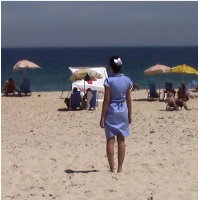
Brasilien am Main, Für Martha, 2016 © Amalia Barboza