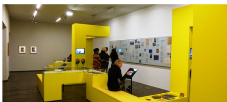
Arnold Schönberg Center