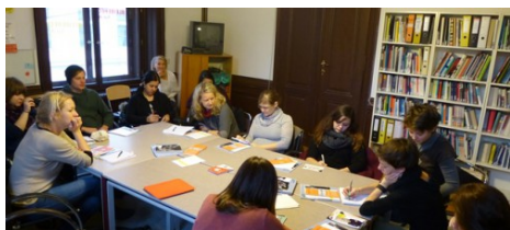
IG Freie Theaterarbeit