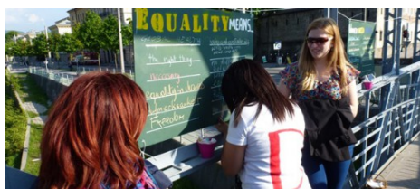
Auf dem Mozartsteg