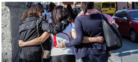
Die T-Shirts sind fertig.