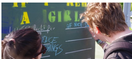
Auf dem Mozarsteg