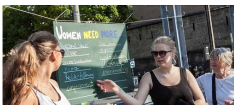
Auf dem Mozartsteg.