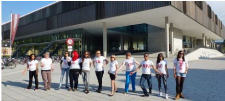
Live to Change!