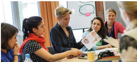
Zine-Workshop.