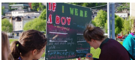
Auf dem Mozartsteg