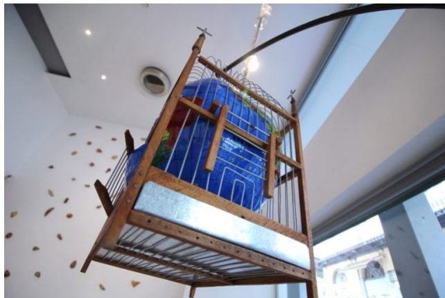
Golden Aid.

gegenwärtigen Realität entfernt ist, fließt sie in mein Werk ein. Ich spreche gegenwärtige Probleme auf ungezierte Art und Weise an und versuche, die Menschen mit dem Titel Golden Aid dazu zu bewegen, sich an die Vergangenheit zu erinnern, und gleichzeitig möchte ich auf Verbindungen, Ähnlichkeiten und Unterschiede zur Gegenwart aufmerksam machen.