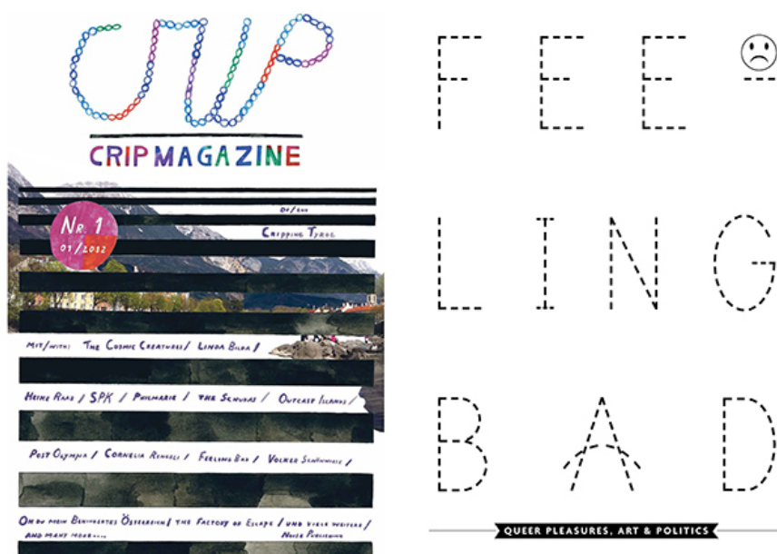
Eva Egermann, Coverdesign Crip Magazine #1 von Anette Knoll Printeretto, 2012. Daphne Boggeri, Feeling Bad, Seite 27 Crip Magazine #1, 2012

Die Beitragenden vertreten verschiedenste Positionen, sind also aus den verschiedenen Communities und haben großteils auf unterschiedlichste Weise eine Behinderungserfahrung. Wenn man sich den Raum des Crip Magazines als sozialen Raum vorstellt, ging es darum, verschiedene Affinitäten und Wahlverwandtschaften zu ermöglichen und einen Raum zu schaffen, der die Kategorien, Diagnosen und Schubladen von Ability und dementsprechend auch Hierarchien von Status und Sprecher*innenpositionen nicht weiter bedient und re-produziert.