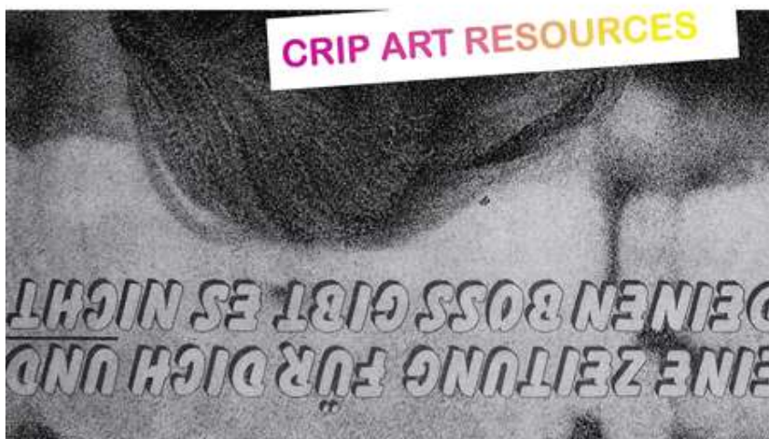
Eva Egermann, Coverdesign Crip Magazine #2 von Anna Voswinckel, 2017.

Was bedeutet für dich „Kultur für alle“ bzw. kulturelle Teilhabe in Salzburg und darüber hinaus? Was fällt dir dazu ein?