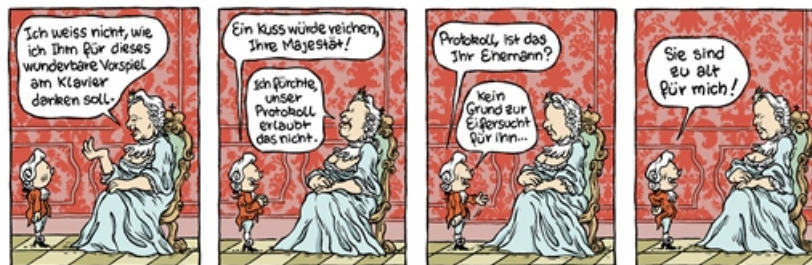
Augel, William (2017): Le petit Mozart. Saint Avertin: Éditions la Boîte à Bulles.