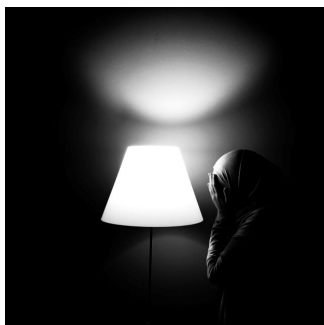
Artwork: light of emotions

Und was machst du aktuell? Bist du aktuell auch als Künstlerin tätig?