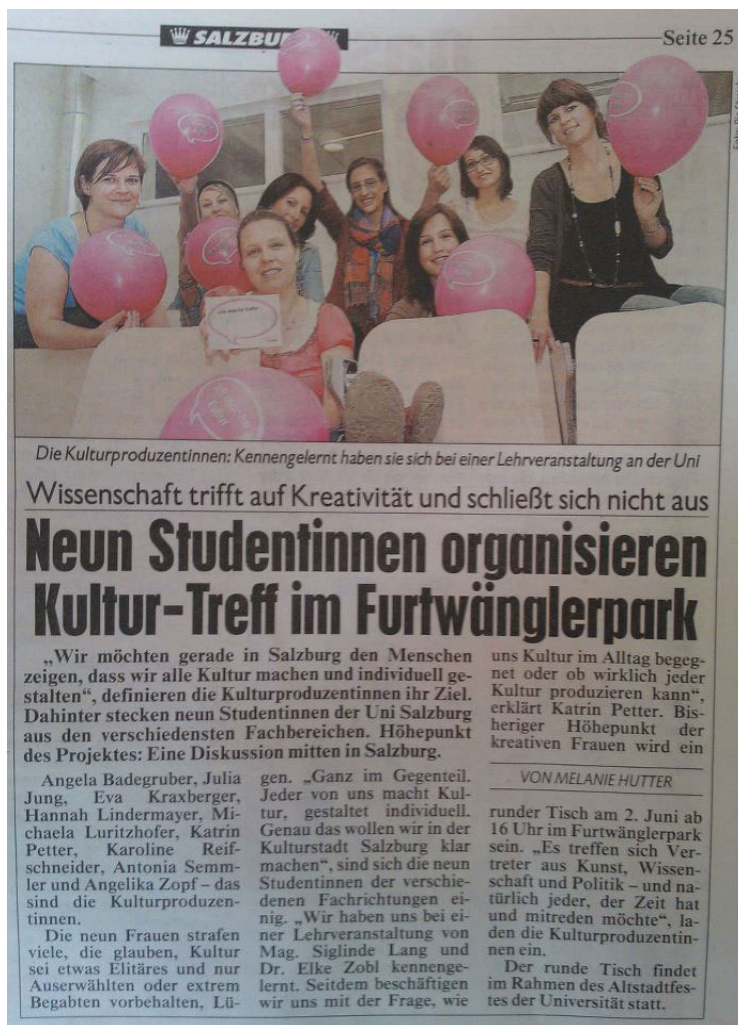
Artikel der Kronen Zeitung