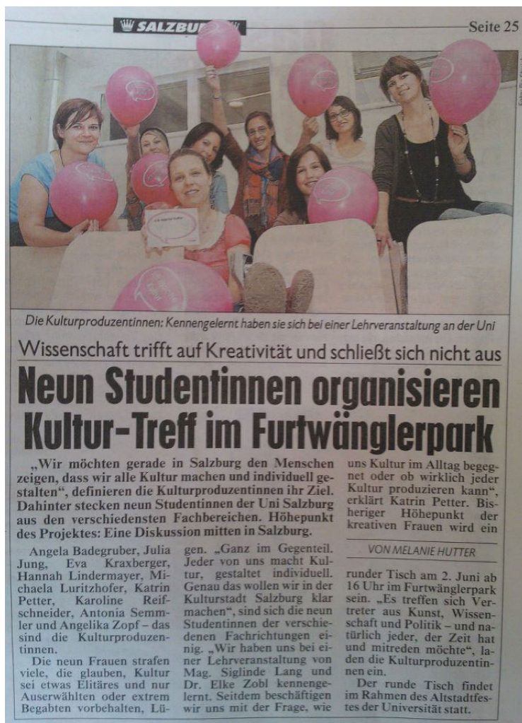
Artikel der Kronen Zeitung

Durch diese Arbeiten im Team wie auch durch die Kooperationen mit Mirjam Winter und Gernot Daucha erlebten die Kulturproduzentinnen die Bedeutsamkeit einer kollegialen Zusammenarbeit. Denn um Kultur zu produzieren, braucht es eine Gemeinschaft.