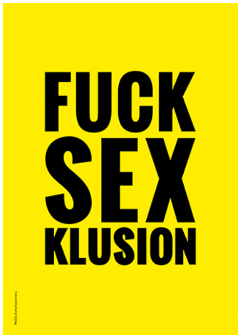
Volker Schönwiese, Wenn du glaubst du bist normal, ... , Seite 27 Crip Magazine #2, 2017. Pro 21 Kampfassistenz, Fuck Sexklusion , Seite 27 Crip Magazine #2, 2017.

Text: Volker Schönwiese , Bildausschnitt aus dem Kupferstich Hochmut von Pieter Bruegel d. Ä., Zyklus zu den sieben Todsünden ca. aus dem Jahr 1560, www.erziehung-heute.de, Dez. 2017 Wie kam der Beitrag in erziehung heute 2017 zustande? Was für eine Zeitschrift ist das? Volker Schönwiese erzählung heute war eine kritische Zeitschrift zum Thema Bildung. Peter Gstettner und ich haben 1977 für eine eA-Nummer behinderte Personen interviewt. Über das Thema Öffentlichkeit und Bewusstsein berichtet und sind für schulische Integration eingetreten. In Österreich war das damals noch sehr neu. Wir druckten auch den Aspekt einer italienischen marxistischen Gruppe von behinderten Menschen ab – „Meravis aus dem Getto“. Aus heutiger Sicht ein erstaunliches und wichtiges Dokument (siehe Kasten rechts unten). Zu dieser Zeit haben wir unter dem Einfluss von Konzepten der Aktionsforschung und in Kenntnis erster internationaler Bürgerrechtsbewegungen von Menschen mit Behinderungen in Innsbruck eine Initiativgruppe gegründet. Sie markierte den Beginn der Selbstbestimmt Leben Bewegung in