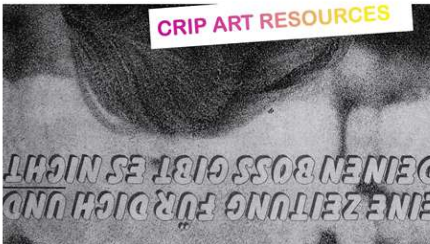
Eva Egermann, Coverdesign Crip Magazine #2 von Anna Voswinckel, 2017.

Was bedeutet für dich „Kultur für alle“ bzw. kulturelle Teilhabe in Salzburg und darüber hinaus? Was fällt dir dazu ein?