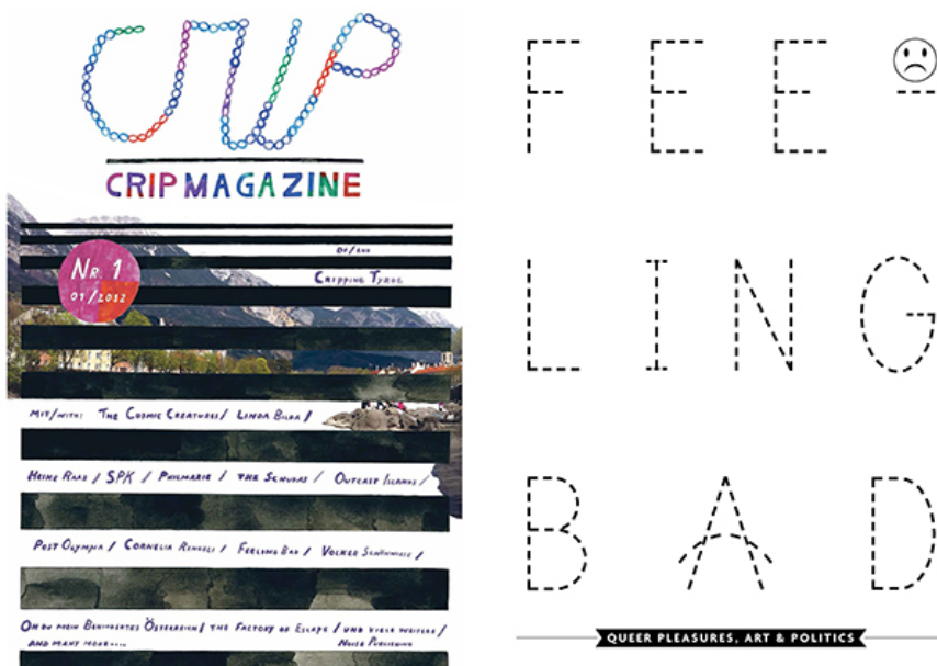
Eva Egermann, Coverdesign Crip Magazine #1 von Anette Knoll Printeretto, 2012. Daphne Boggeri, Feeling Bad, Seite 27 Crip Magazine #1, 2012

Die Beitragenden vertreten verschiedenste Positionen, sind also aus den verschiedenen Communities und haben großteils auf unterschiedlichste Weise eine Behinderungserfahrung. Wenn man sich den Raum des Crip Magazines als sozialen Raum vorstellt, ging es darum, verschiedene Affinitäten und Wahlverwandtschaften zu ermöglichen und einen Raum zu schaffen, der die Kategorien, Diagnosen und Schubladen von Ability und dementsprechend auch Hierarchien von Status und Sprecher*innenpositionen nicht weiter bedient und re-produziert.