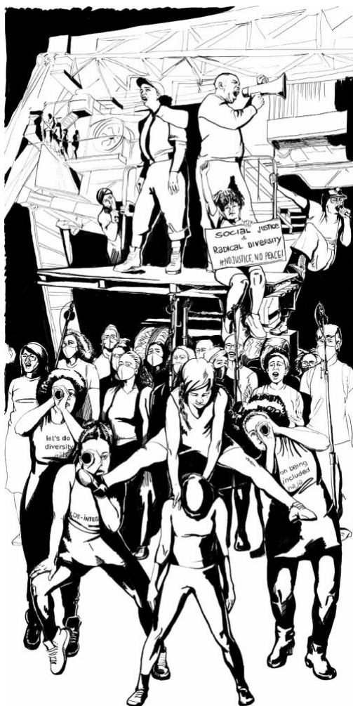
D/Transformation – Diversität in Entscheidungspositionen im Kulturbetrieb. Format: 1200x2440mm Kartonwabe- /Sandwichplatteplatte Druck

da sind und somit im „Adaptierungsprozess“ als zugänglicher phantasiert werden, dient in einer EU-governmental-Logik der Kontrolle. Nur mit jenen, die bereits länger da sind, ein wenig auf der Diversitäts-Ebene arbeiten zu wollen, ist nicht ausreichend. Das sind für mich die Fragen und Überlegungen, die es gilt, in diese Diskurse über Diversität und Öffnung mit einzubeziehen.