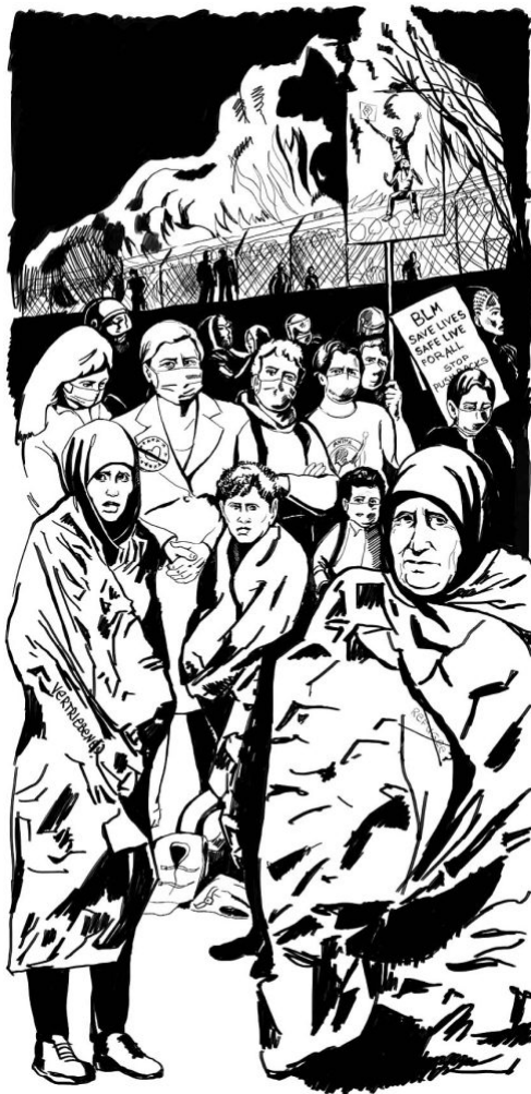
D/Transformation – Diversität in Entscheidungspositionen im Kulturbetrieb. Format: 1200x2440mm Kartonwabe- /Sandwichplatteplatte Druck

Die Arbeiten für die Veranstaltung D/Transformation – Diversität in Entscheidungspositionen im Kulturbetrieb im Belvedere Museum haben sehr sichtbar die Podiumsdiskussion begleitet. Magst du etwas mehr dazu erzählen?