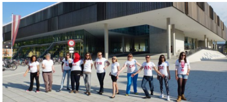
Live to Change!