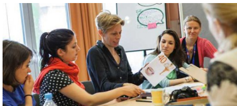
Zine-Workshop.