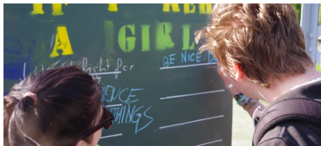
Auf dem Mozartsteg