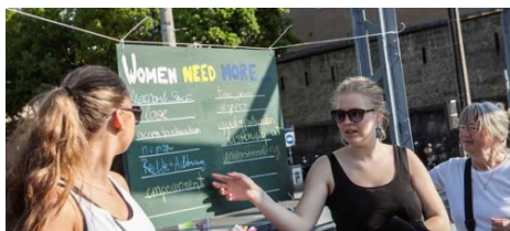
Auf dem Mozartsteg.