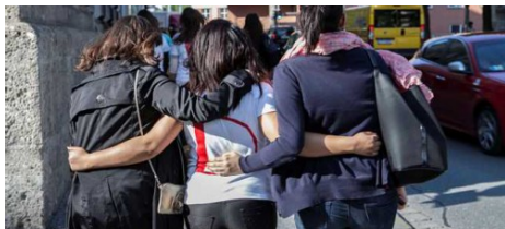
Die T-Shirts sind fertig.