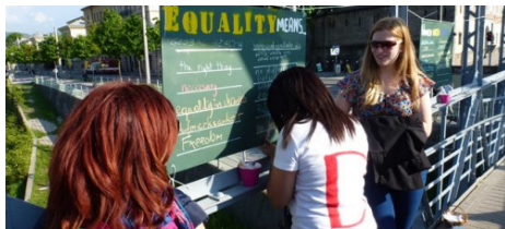
Auf dem Mozartsteg