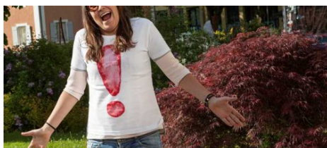
Die T-Shirts sind fertig.