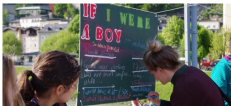
Auf dem Mozartsteg