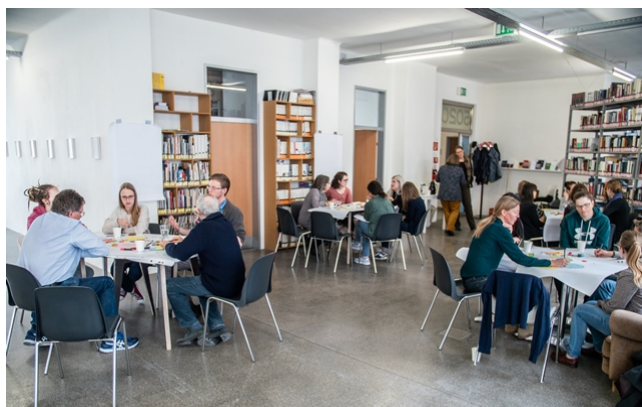
Die Räume der Fünzigzwanzig eignen sich hervorragend für das Format Worldcafé.