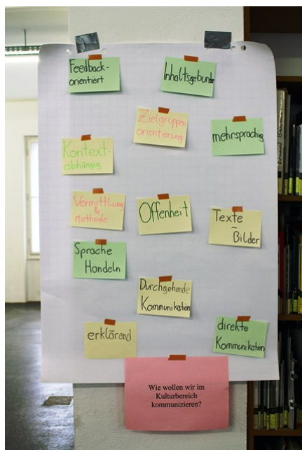
Diese Ergebnisse präsentierte die Gruppe zum Thema „Wie wollen wir kommunizieren?“.

Ausprägung zu vermeiden. Zudem ist es ihnen ein Anliegen, dass die Kommunikation im Kulturbereich Feedbackorientiertheit mit sich bringt und stets inhaltsgebunden sowie kontextabhängig bleibt. Direkter interpersoneller Austausch soll ohne Umwege vonstattengehen. Einige Teilnehmende waren auch der Ansicht, die Kommunikation im Kulturbereich dürfe mutiger sein und mehr Offenheit transportieren, sodass ganz unterschiedliche Zugänge der Kommunikation gewählt werden können, intra- sowie extrainstitutionell. Die Studierenden wünschen sich mehr Sensibilität, Freundlichkeit und Deutlichkeit in der Kommunikation des Kulturbereichs. Darüber hinaus müsse man zu jeder Zeit die Zielgruppe(n) im Auge behalten und in der Vermarktung stark auf sie eingehen, wobei dennoch die inhaltliche Richtigkeit eine zentrale Rolle spiele. Viele wünschen sich Eventkalender und Newsletter, am besten städteübergreifend und transnational, um über Veranstaltungen in ihrer Umgebung besser informiert zu werden. Generell waren die Teilnehmer*innen der Meinung, verschiedene Arten der Kommunikation müssten auch unterschiedliche Methoden und Zugänge wählen, um erfolgreich zu sein. Somit könnte es beispielsweise für eine Einrichtung sehr unterstützend sein, mit einer Mischung aus verbalen und visuellen Darstellungsformen, also Texten und Bildern, in der Werbung zu arbeiten.