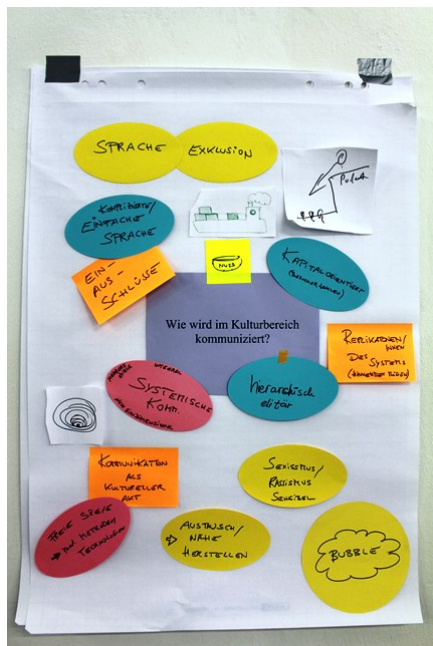
Die Ergebnisse in Stichworten.