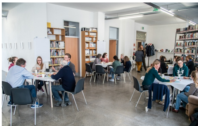
Die Räume der Fünzigzwanzig eignen sich hervorragend für das Format Worldcafé.