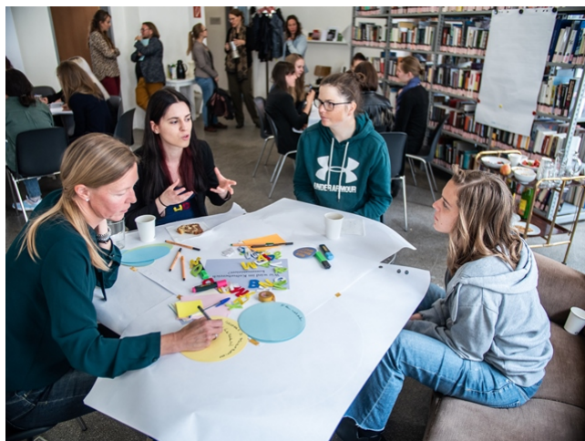
An diesem Tisch war die Kommunikation im Kunst- und Kulturbereich das Thema.

Weiters wurde diskutiert, dass elitäre künstlerische Institutionen meist elitäre Ausdrucksweisen verwenden. Dies zeigt u.a., wie sich diese Organisationen nach außen hin darstellen wollen, denn die Verwendung bestimmter Sprachen und Sprachstile bestimmt, wer sich angesprochen fühlt. Es werden also bestimmte Zielgruppen erreicht und andere ausgeschlossen. Hier stellt sich die Frage, ob verschiedene Arten der Diskriminierung vorliegen, z.B. Diskriminierung gegen Personen anderer Kulturen und Sprachen (wenn Texte nur in einer Sprache geschrieben sind). Auch die sogenannte ‚Leichte Sprache‘ findet sich selten in solchen Kunsteinrichtungen.