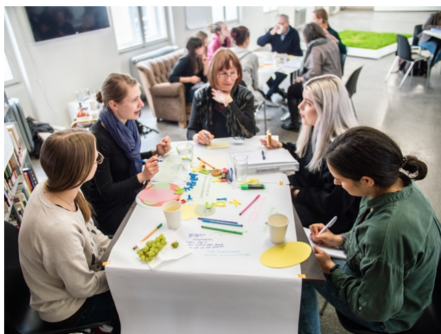
Zum Thema „Wie wollen wir arbeiten“ fiel den Teilnehmer*innen einiges ein.

Ein in den Diskussionen immer wiederkehrendes Anliegen betrifft das stark mangelnde Ansehen von Berufen im Kulturbetrieb. In der Gesellschaft müsste daher mehr Bewusstsein für die Wertschätzung der bedeutenden schöpferischen Arbeit von Kulturberufen geschaffen werden.