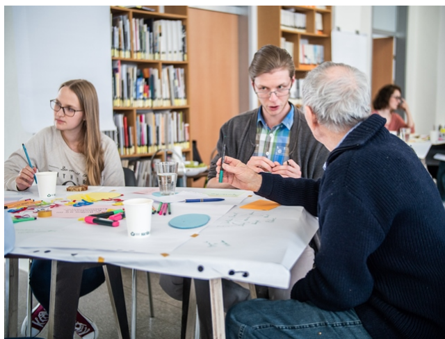
Das Thema „Wie wollen wir kommunizieren“ wird hier besprochen.

Auch am Tisch der Frage Wie wollen wir im Kulturbereich kommunizieren? diskutierten die Teilnehmenden lebhaft. Sie waren häufig einer Meinung, tauschten Ansichten aus und ergänzten Aspekte.