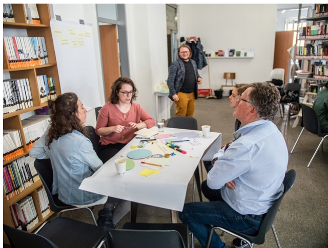
Die Gruppe beim Diskutieren darüber, wie im Kulturbereich gearbeitet wird.

Umstritten sind ebenfalls die Arbeitsverträge, in deren Bindung viele Tätige im Kulturbereich stehen. Denn diese Verträge garantieren zwar ein regelmäßiges Einkommen für die Kulturschaffenden, nehmen denselben jedoch gleichzeitig ihre zeitliche und örtliche Unabhängigkeit. So müssen sich Kulturarbeiter*innen oft an ein einziges Projekt binden, anstatt ihren Interessen vollständig nachgehen und sich an mehreren Arbeitsmöglichkeiten beteiligen zu können.