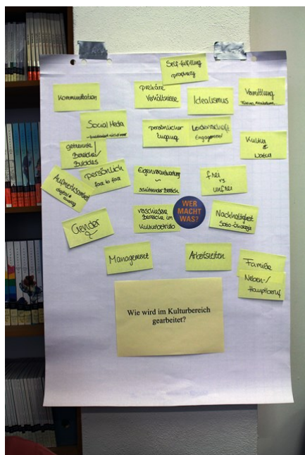
Die Ergebnisse zum Thema Arbeit im Kulturbereich.